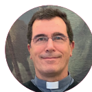
Federico Mantaras Ruiz-Berdejo Administrador diocesano de Asidonia-Jerez

Para que nuestra Iglesia de Asidonia-Jerez pueda llevar a cabo la misión que Cristo nos encomienda, os invito este año a la generosidad para que aportemos lo que tenemos: cualidades, tiempo o dinero. Necesitamos vuestra ayuda material para terminar de construir el nuevo seminario y las nuevas parroquias proyectadas, pero también necesitamos el trabajo y la oración de todos.