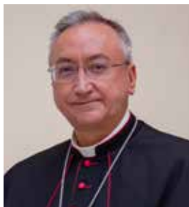
† José Rico Pavés Obispo de Asidonia-Jerez

a la desordenada satisfacción de las pasiones, es necesario añadir al grito del santo doctor de la Iglesia la proclamación del amor verdadero: «¡Que todos sepan que no hay amor sin entrega!».